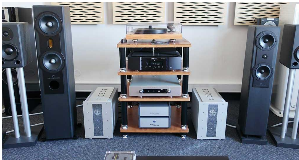
studio Rodel Audio - Praha

Jedním z vrcholů současného katalogu jsou pak jednobanální koncové stupně s prostým názvem Mono - menšími z nich s označením Mono II jsme se mohli potěšit v pražském studiu Rodel Audio . Accoustic Arts Mono II mají opravdu pěknou podobu, jejich věžovitá konstrukce působí kompaktně a přitom díky protažení směrem vzad a už na první pohled excelentnímu zpracování budí dojem důstojnosti a spolehlivosti.